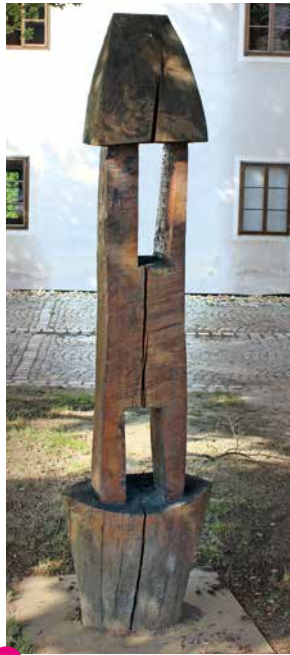
2 János Kalmar Intervallum