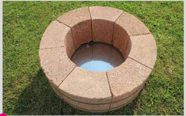
5 Manfred Hirschbrich „8/8“