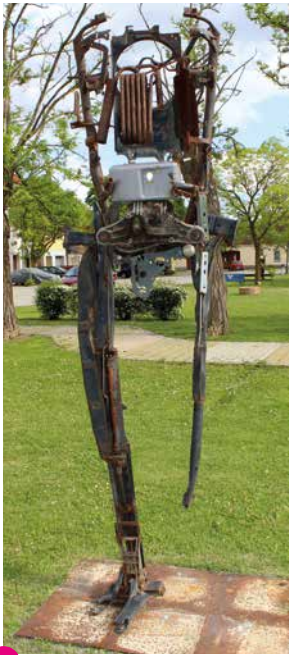
8 Czesław Podlesny The Castaway