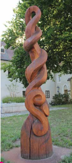
3 Pavel Spelda Wasserquelle