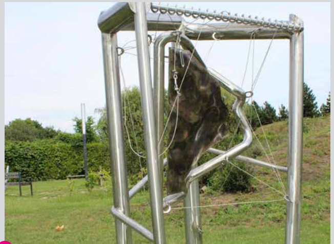
37 Atanas Kolev Sinn des Lebens