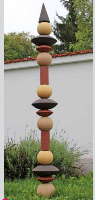
15 Ulrike Dressel Wächter