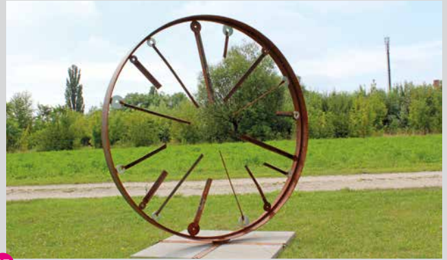
35 Silvia Gröbner Lebensbaum