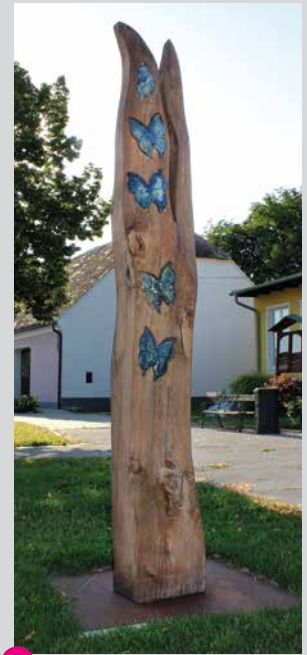
43 Lidia Rosinska O.T. (Wulzeshofen, Hauptstraße)