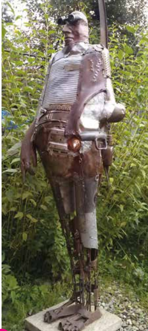
10 Czesław Podlesny Der Weitblickende