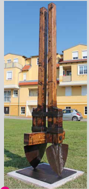
13 Walfried Huber Schaufeldenkmal