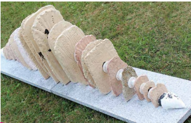
26 Ingrid Neuhold Fossil