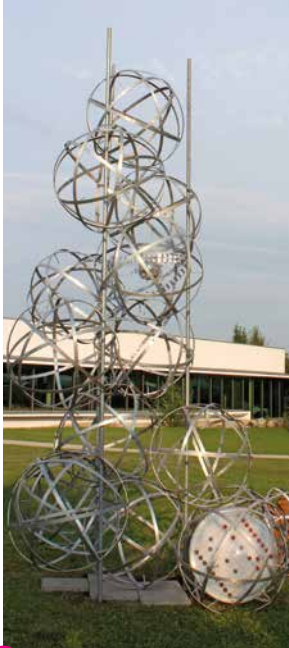
40 Rolling Stars and Planets Konzentrik