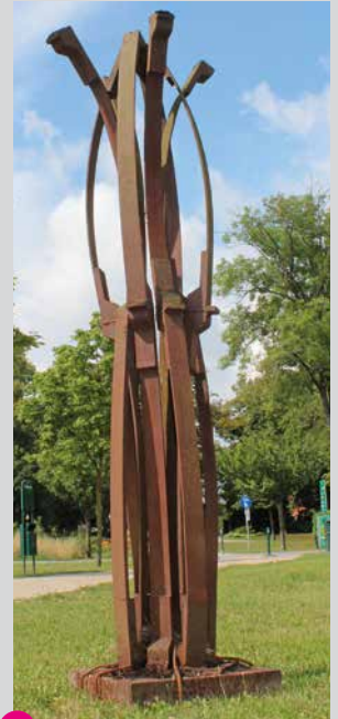
28 Rolf Laven Feder_Klang_Spiel