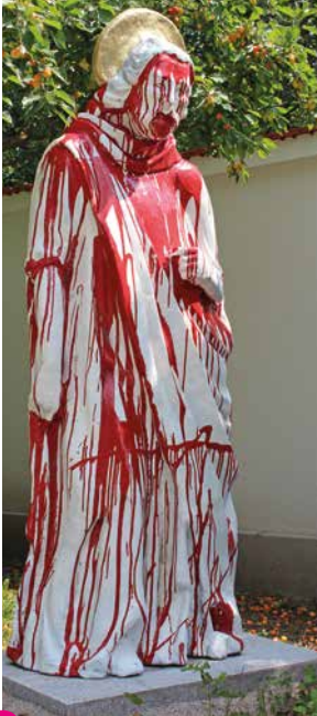
18 Christian Reichhold Scheinheilige IV - St. Hermann